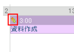
依頼したタスク (矢印アイコン)