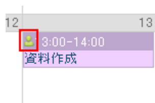
自分のタスク (人アイコン)